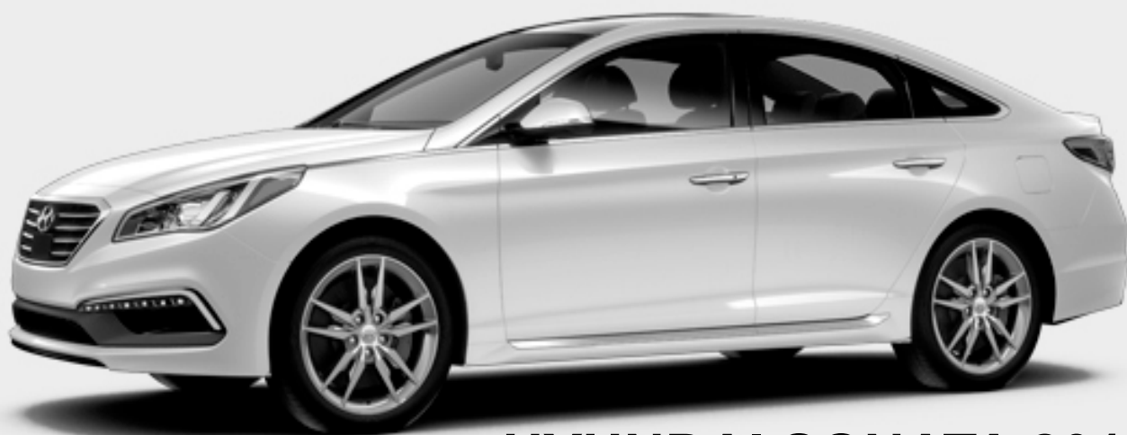
HYUNDAI SONATA 2016