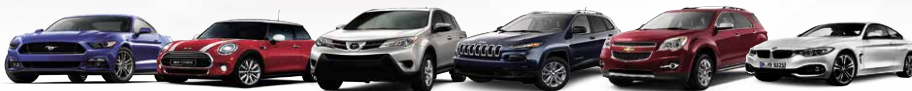
Prizes may not be exactly as shown.

Call for a quote and see what you could save.