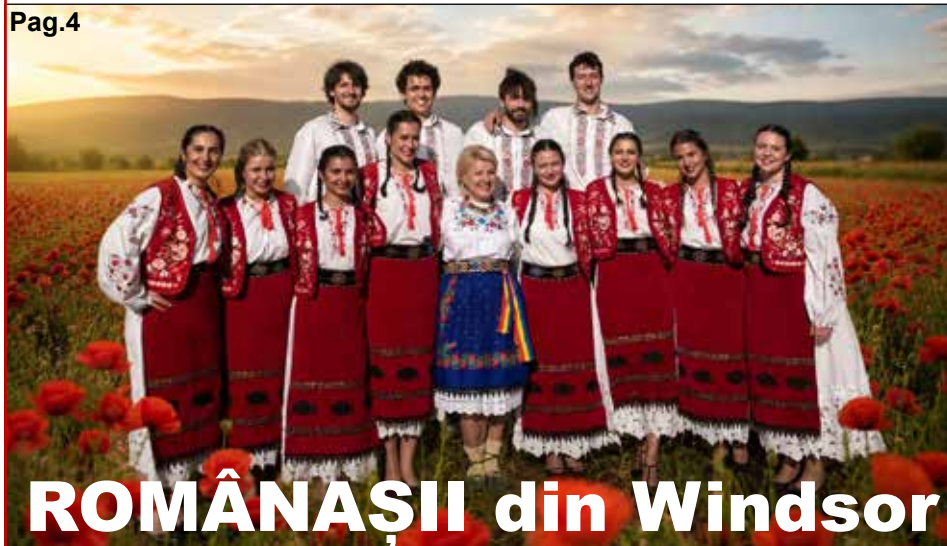
ROMÂNĂȘII din Windsor