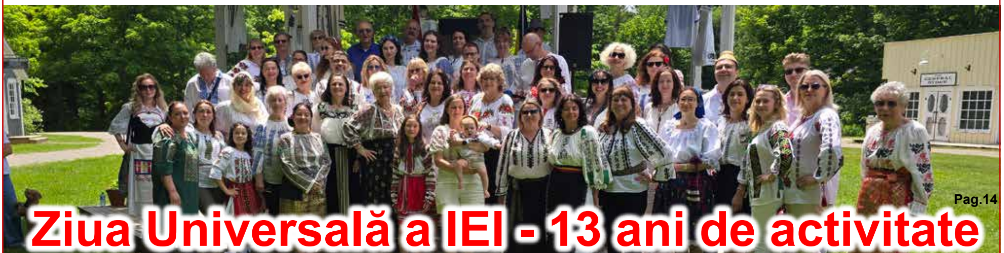
Ziua Universală a IEI - 13 ani de activitate